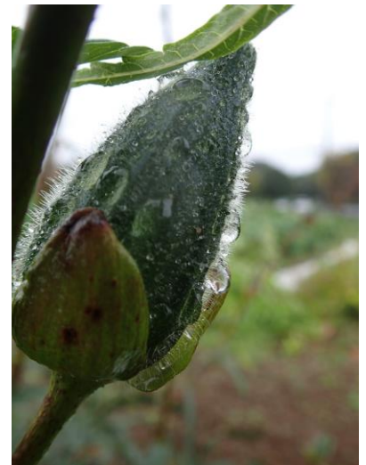
〈とろろあおいの実〉

さて、虫たちはどうしているかとあちこち探してみる。いつもなら人の気配を察していろんな虫が飛び出すのだが、今日は居留守のようだ。ならばと借金取りのように隈なく探し回ると、いたいた。シソの茎にしがみついているツチイナゴ、レモンバームの葉裏にはユウマダラエダシャク?、寒くて動けなくなったのだろうか、ジガバチはさながら修行僧のように冷たい雨に打たれていた。急激な寒さで動きが鈍くなってきた虫たちは、カメラを近づけてもじっとしている。写真を撮るには好都合だが、本来の命の躍動が見られず寂しい限りだ。野菜も花も虫たちも寒くても雨が降ってもじたばたせず、まるで悟ったかのように諦観している。見習わねば。