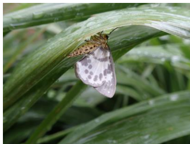
〈ユウマダラエダシャク?〉