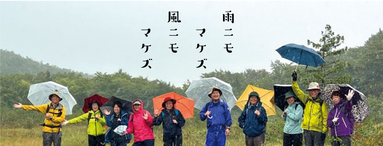
セミナー参加者全員で世界谷地湿原を散策して雨の自然も体感

いて過ごしてきた澤口さん自身の 体験のほかに、育児経験から紡ぎ出 された数々の言葉もあります。 「長男は中学生くらいまで、園や学 校で『困った子』でした。彼は勉強 をしなかったけれど、自然が好き で、生きものを見つけたら、飼うこ とがとても上手。でも学校は、子ど もの良さを測る尺度が学力とス ポーツくらいしかないので、