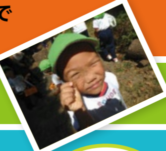
みのり保育園 東京都府中市

ポイント 3 園庭や近所の公園の自然遊びが変わる 60種類の自然遊びマニュアルが手に入る!