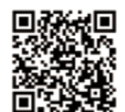
〈ジャンケン落ち葉集め〉はこちらへ↑

ネイチャーゲーム(ジャンケン落ち葉集め)の活動をしています。イラストのワンシーンに潜む「リスク(あぶないもの・こと)」を見つけて印をつけましょう。解説は次のページへ。●イラスト: 檜山知弘 (woodyhouse designs)